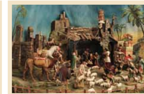
Autore: Arcangelo Bozzetta Provenienza: Tesero Anno di realizzazione: 1912 Figure scolpite a mano in legno di cirmolo e dipinte