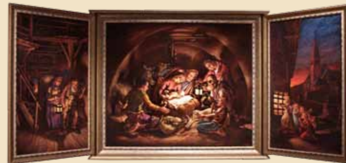
Autore: Felix Deflorian Provenienza: Tesero Anno di realizzazione: Recente Trittico dipinto ad olio