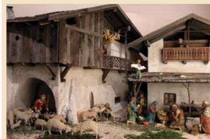
Autore: Severino Doliana Provenienza: Tesero Anno di realizzazione: 1920 Presepio con figure in legno di cirmolo scolpite a mano e dipinte, con ricca scenografia di scorcio di paese trentino

rie regioni italiane e, in particolare, in area tirolese il presepio comincia ad entrare nelle case della gente.