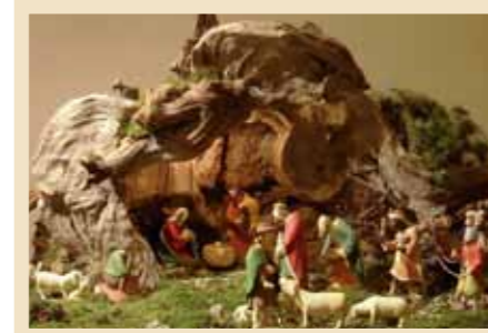
Autore: Giorgio Zanon Provenienza: Tesero Anno di realizzazione: 1988 Figure scolpite a mano in legno di cirmolo e dipinte