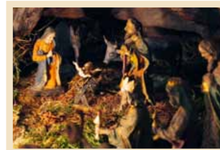
Autore: Giovanni Doliana Provenienza: Tesero Anno di realizzazione: 1920 Figure scolpite a mano in legno di cirmolo e dipinte