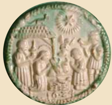
Autore: Ignoto Provenienza: Tesero Anno di realizzazione: 1624 Olle in ceramica di antica stufa raffiguranti la nascita di Cristo, l'adorazione dei Magi e il Paradiso Terrestre