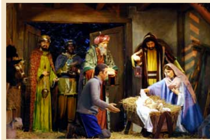
Autore: Associazione Amici del Presepio Felix Deflorian Provenienza: Tesero Anno di realizzazione: 2009 Presepio con statue a grandezza naturale inserite in fienile rurale fiemmesse

Una delle tradizioni che si è mantenuta viva, nonostante i profondi mutamenti sociali, economici e culturali verificatisi negli ultimi tempi nelle valli della provincia di Trento è quella del presepio.