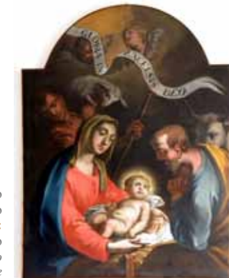
Autore: Ignoto Provenienza: Tesero Anno di realizzazione: XVIII secolo Olio su tela di ignoto artista fiemmesse