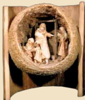
Autore: Leo Deflorian Provenienza: Tesero Anno di realizzazione: Recente Composizione sferica in trucioli e legno