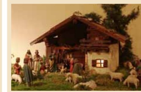
Autore: Severino Doliana Provenienza: Tesero Anno di realizzazione: 1920 Figure scolpite a mano in legno di cirmolo e dipinte