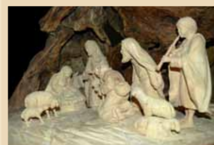
Autore: Leo Deflorian Provenienza: Tesero Anno di realizzazione: Recente Grotta in ciocca di legno con figure e scenografia scolpite in legno