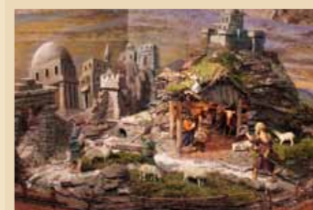
Autore: Pietro Deflorian Provenienza: Tesero Anno di realizzazione: 1920 Presepio scolpito a mano in legno di cirmolo e dipinto, con originale scenografia orientale in bassorilievo scolpito